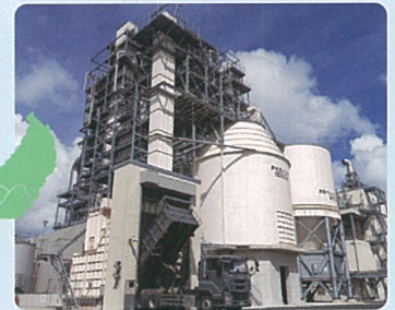
中城バイオマス発電所 【再生可能エネルギー:FIT電源】 沖縄うるまニューエナジー株式会社

※2: 1世帯当り 247.8kWh/月(平成27年度)で算出。出典:電気事業連合会「電力事情について」